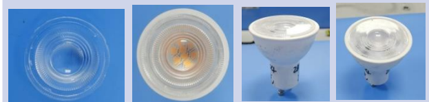
GU10 36D 50W ND WW/CW