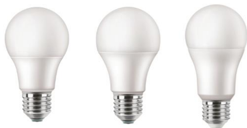
A60 FR E27 60/75/100W ND WW